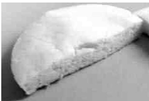
Galleta en su presentación CROCANTE

Desarrollan un alimento deshidratado listo para consumir