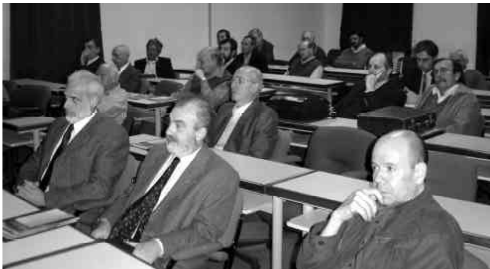
El público asistente escuchó con interés la disertación sobre conversión de hidrógeno a cargo del Dr. Walter Triaca.

Por último, Triaca presentó los recientes avances a nivel mundial en el campo del almacenamiento de hidrógeno y, en particular, las investigaciones realizadas en los últimos años en el INIFTA orientadas al diseño racional y al mejoramiento de las propiedades físicas y químicas de materiales con alta capacidad de acumulación de hidrógeno. Adelantó que se está aplicando tecnología basada en hidrógeno, en baterías y en sistemas de almacenamiento de electricidad del satélite argentino SAC C así como en el diseño de baterías para los satélites SAC COM y SAC D, que serán puestos en órbita en 2007. ■