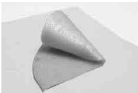
Alimento en su versión FLEXIBLE