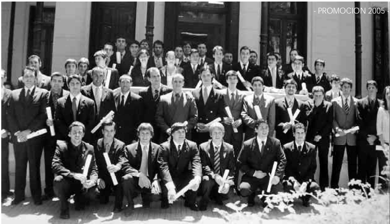
- PROMOCION 2005 -