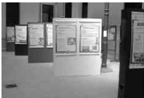
Sesión de POSTERS, en el Patio Volta.

Por la tarde, las actividades se centraron en la sesión de pósters dispuesta en el Patio Volta del Edificio Central, donde las Unidades, Laboratorios y Grupos de Investigación y Desarrollo de la Casa expusieron sus líneas específicas de trabajo.